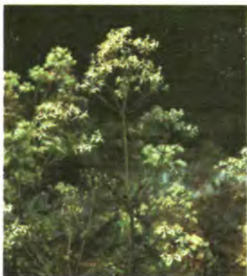
315. Ломиніс прями́й.